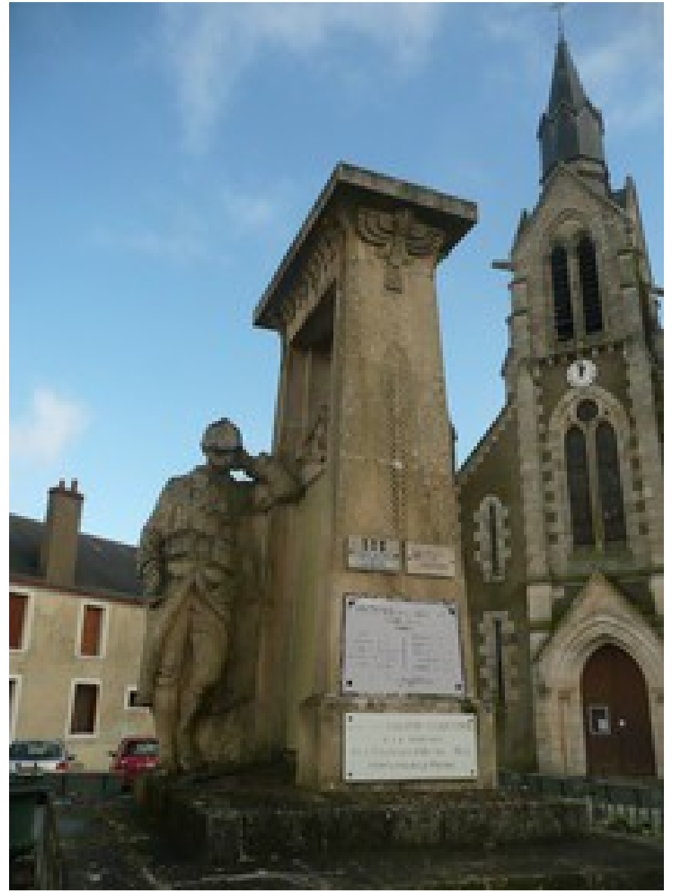
Deux monuments aux morts, à Saint-Benoît-du-Sault, à Eguzon.