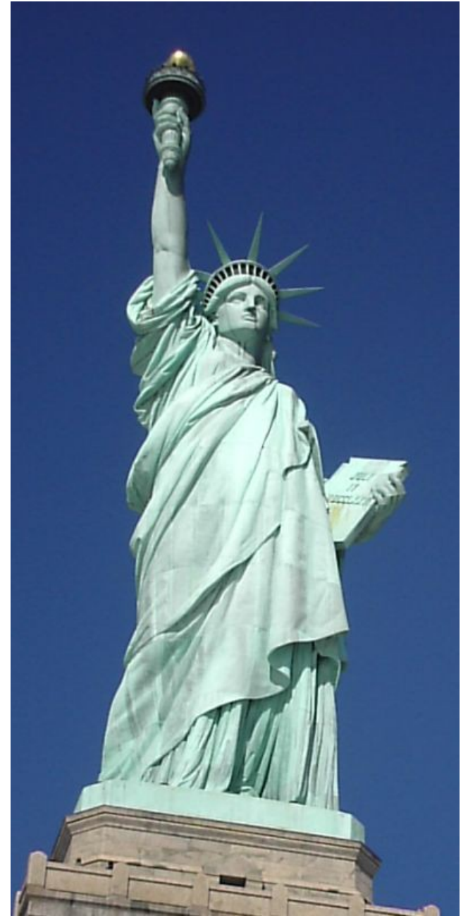
La Statue de la Liberté, Auguste Bartholdi, 1876.