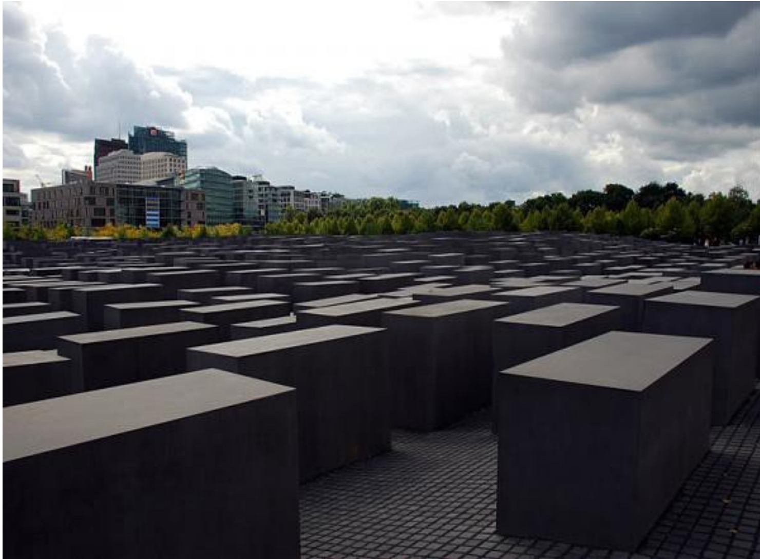
Le Mémorial de l'Holocauste, Peter Eisenman, 2005.