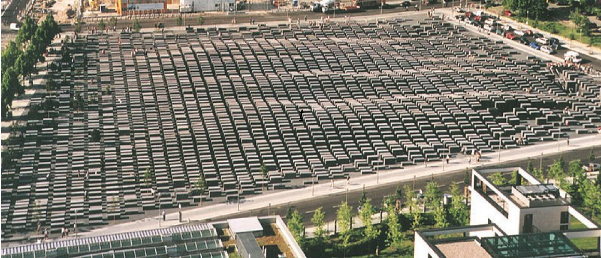
Le Mémorial de l'Holocauste, Peter Eisenman, 2005.