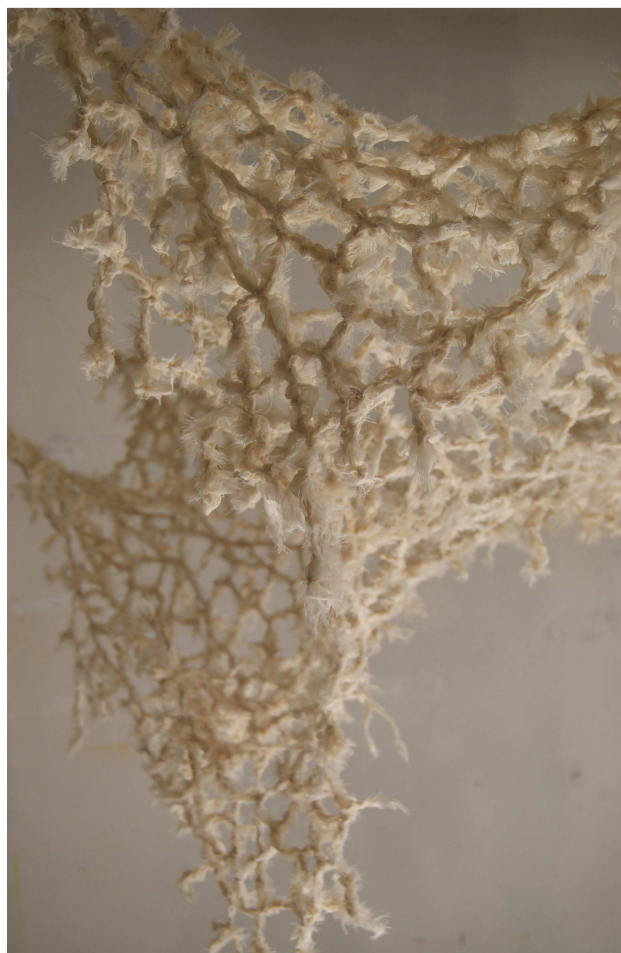
La vilaine – détail

Demi-disque de lin brodé de fils de coton Ø : 90 cm, largeur : 22.5 cm