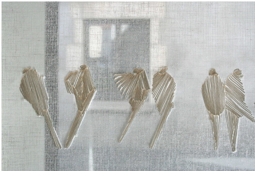
Oiseaux – Détail Singalette, coton à broder, 75 x 1300 cm, 2011